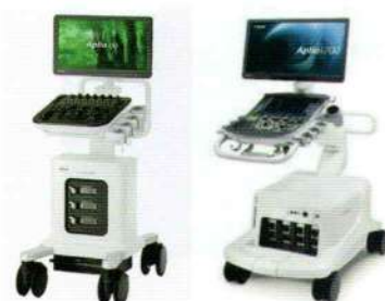
つばさクリニック 両国東口クリニック